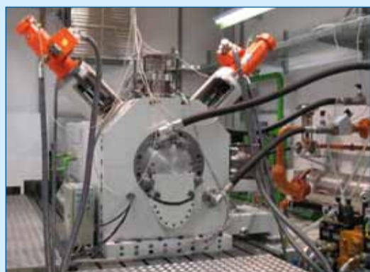
Figuur 3. De nog in aanbouw zijnde testopstelling voor glijlagers.