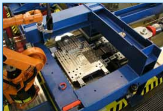
Figuur 1. De testopstelling voor het testen van lasnaden.