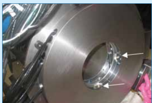
Figuur 4. De sensoren zijn geplaatst in de ruimte waar het smeermiddel in verwerkt zit.

Wervelstroomsensoren worden in diverse applicaties gebruikt. Veelal gaat het hierbij om aanwezigheidsdetectie, maar met een analoge sensor kunnen ook afstanden en daarmee ook verplaatsing en trillingen gemeten worden. Hierbij kan men rekenen op metingen in het nanometerbereik waardoor heel nauwkeurig gemeten kan worden. Daarbij hoeft de sensor zelf niet groter te zijn dan 2 mm doorsnede waardoor hij geschikt is voor zeer veel applicaties.