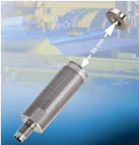
Bei Magneto-induktiven Sensoren wird der Messbereich mit dem verwendeten Magneten festgelegt; 55 mm sind möglich

tet oder abgesetzt gefertigt werden. Bislang wurde die Technologie ausschließlich bei besonderen Projekten für Kunden angewendet. Künftig soll das Verfahren auch auf die Standardsensoren übertragen werden.