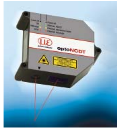
Der OptoNCDT2300 ▶ ist das neue High-end-Modell unter den Triangulationssensoren

lung passt sich den Messobjekt-eigenschaften in noch größerem Umfang an. Die Datenausgabe erfolgt per Ethernet, RS422 oder Ethercat. Dies ist ebenfalls ein Novum, da die Datenraten dieser schnellen Sensoren bisher häufig nur über Analogausgänge übertragen werden konnten. Der Sensor kann nun gleichermaßen für die Dickenmessung transparenter Objekte sowie zur herkömmlichen Abstandsmessung eingesetzt werden.