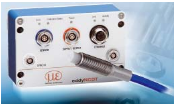
Für die hohe Benutzerfreundlichkeit des EddyNCDT3100 sorgen die Konfiguration per Weboberfläche und Speicherbausteine in den Sensoren

Flexibel ist auch die geometrische Ausprägung der Sensoren, die sich je nach Kundenanforderung anpassen lässt. Dabei kann der Sensor entweder mit der Elektronik zusammen eingebet-