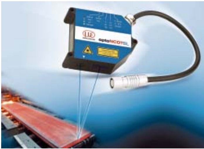
◀ Sensoren mit blauem Laserlicht punkten bei glühenden Metallen und organischen Stoffen