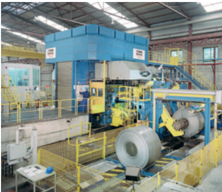
▲ Für die automatische Produktion veranlasst der Durchmesserwert des Coils den automatischen Wechsel.

In kommunalen Abwasseraufbereitungsanlagen liegt das Hauptaugenmerk auf dem Schutz der nachfolgenden Gewässer. Damit ist der Abbau der Schadstofffrachten (oxidierbaren Komponenten) und der Nährstoffe oberstes Gebot. Denn in den nachfolgenden Gewässern sollen möglichst wenig sauerstoffzehrende Komponenten und Nährstoffe (Stickstoff-Verbindungen) eingesetzt werden, die zusammen das dortige biologische Gleichgewicht stark stören könnten.