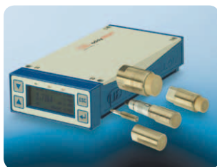
Obr. 2 Snímač využívajúci princíp vírivých prúdov s regulátorom na vyhodnocovanie údajov

Tento merací princíp možno využiť pri všetkých elektricky vodivých materiáloch. Nakoľko vírivé prúdy prenikajú izolantnými materiálmi, možno ako meraný objekt využiť len kovovú časť nachádzajúcu sa za vrstvou izolácie. Vďaka špeciálnemu spôsobu navinutia cievky možno dosiahnuť veľmi kompaktné rozmery snímačov, ktoré možno využiť pre široké spektrum vysokých teplôt. Všetky snímače využívajúce vírivé prúdy sú necitlivé na prach, znečistenie, vlhkosť, masť a tlak.