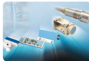
Obr. 4 Najnovší snímač od Micro-Epsilon pre drsné prostredia a špeciálne aplikácie využíva technológiu ECT

Nový snímač eddyNCD ECT (Embedded Coil Technology) vôbec nevyžaduje konvenčne navinutú cievku. Namiesto toho je na anorganickom materiáli zabudovaná dvojrozmerná cievka takým spôsobom, že to zaručuje stabilný geometrický tvar a teplotu. Nové snímače majú aj špeciálny tvar a to preto, že sa vyvíjajú pre špecifické aplikácie. Snímače možno rozoznať aj podľa modrej farby ich povrchu na mieste, kde je umiestnená cievka.