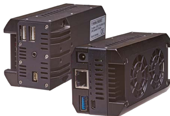
thermoIMAGER TIM NetBox