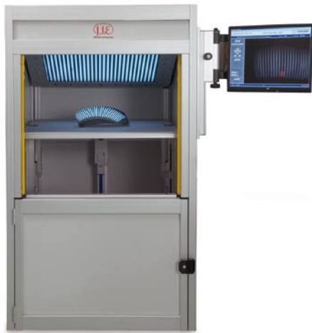
RC-Compact: Inspektionssystem mit motorisiertem Objektträger