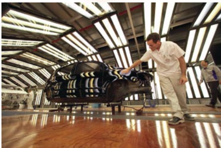
Sichtprüfungen werden durch das vollautomatische reflectCONTROL ersetzt