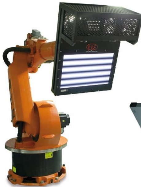
RC-Robotic: Voll-Inspektion einer PKW Karosserie in nur 60 Sek (4 Roboter)