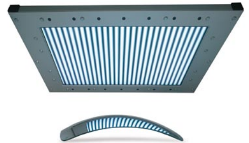
RC-Custom: Basismodul für die kundenspezifische Integration