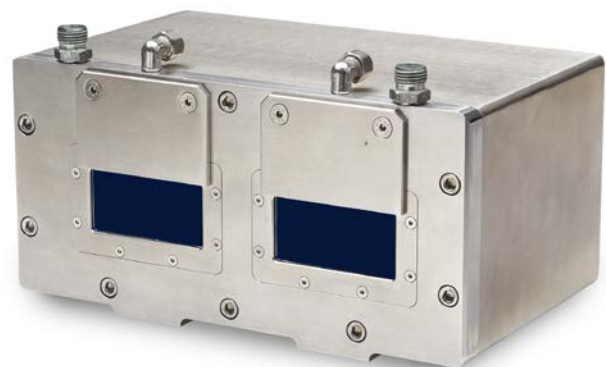
SGHx ILD Größe M (140 x 180 x 71 mm) für optoNCDT 1750 / 2300 mit Baugröße 150 x 80 mm