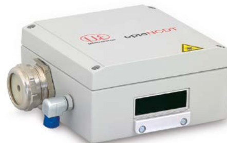
SGHx ILD Größe S (140 x 140 x 71 mm) für optoNCDT 1750 / 2300 mit Baugröße 97 x 75 mm

Minimum Wasserdurchfluss Q(\min) = 3 \text{ Liter/min}