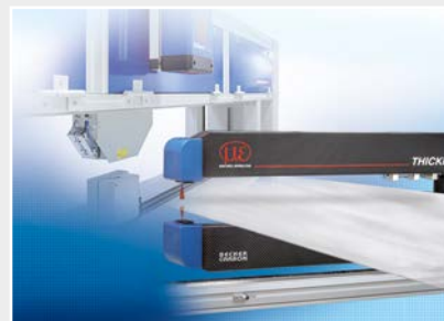
Installations de mesure et de contrôle pour l'assurance qualité