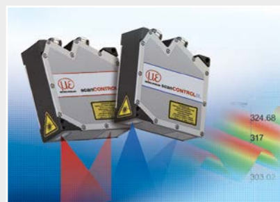
Capteurs de profil à ligne laser par triangulation 2D/3D