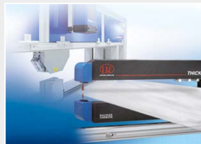
Installations de mesure et de contrôle pour l'assurance qualité