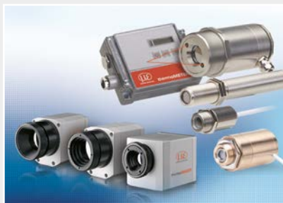
Capteurs et systèmes de mesure de température sans contact (pyromètres)