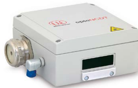
SGHx ILD Größe S (140 x 140 x 71 mm) für optoNCDT 1750 / 2300 mit Baugröße 97 x 75 mm

Minimum Wasserdurchfluss Q(\min) = 3 \text{ Liter/min}