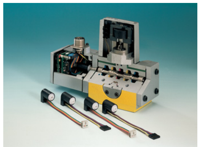
Induktive Wegsensoren (LVDT-Prinzip) in Hydraulikventilen der Fa. MOOG